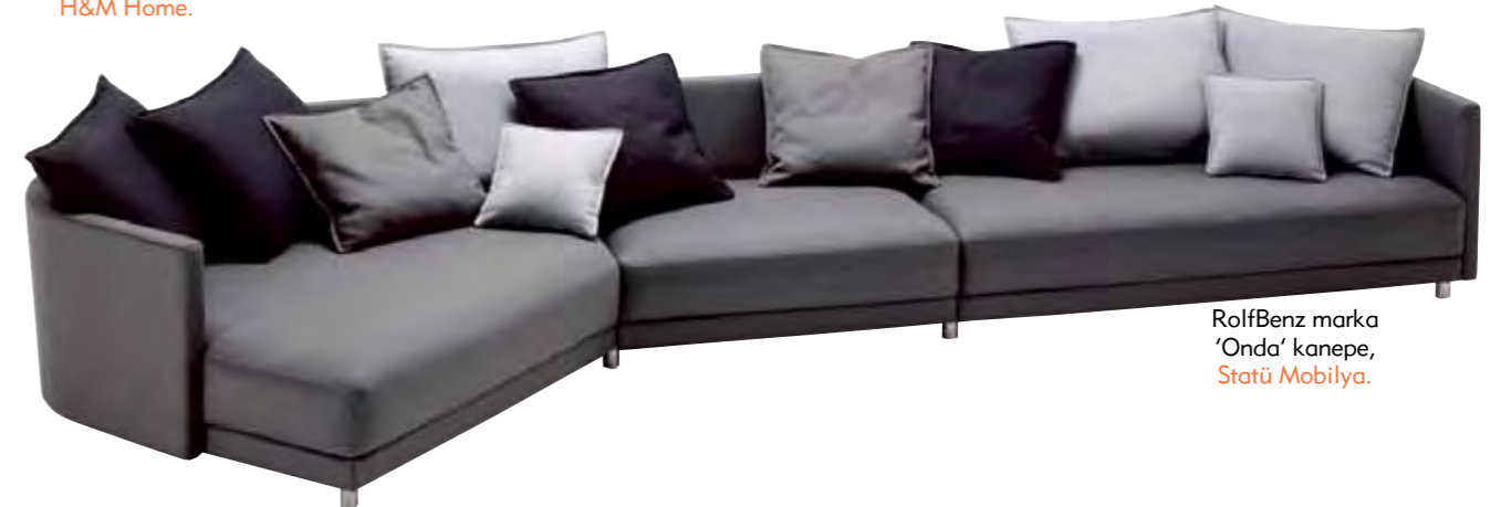
RolfBenz marka ‘Onda’ kanepesi, Statü Mobilya.