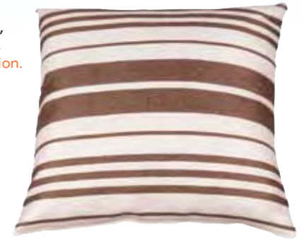
Keten yastık, 16,45 TL. www.designstatehome.com