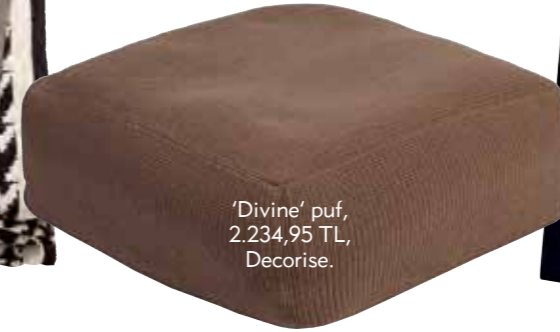
‘Divine’ puf, 2.234,95 TL, Decorise.