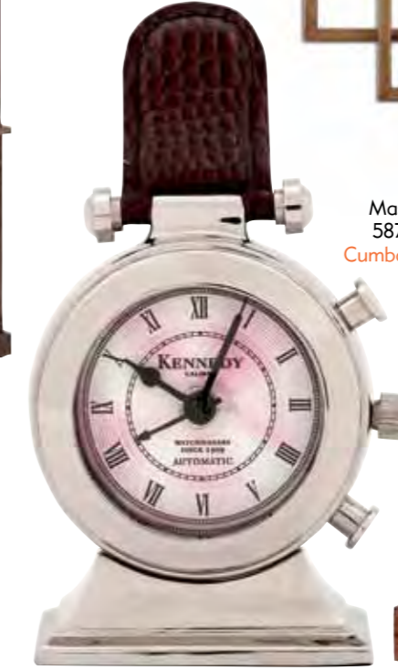
Masa saati, 587,80 TL, Cumba Selection.