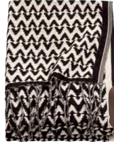
Koltuk şalı, 59,99 TL, H&M Home.