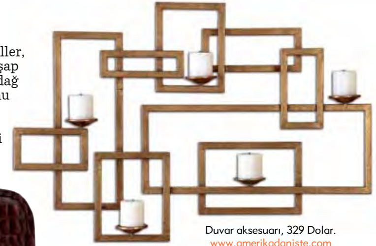
Duvar aksesuarı, 329 Dolar. www.amerikadaniste.com