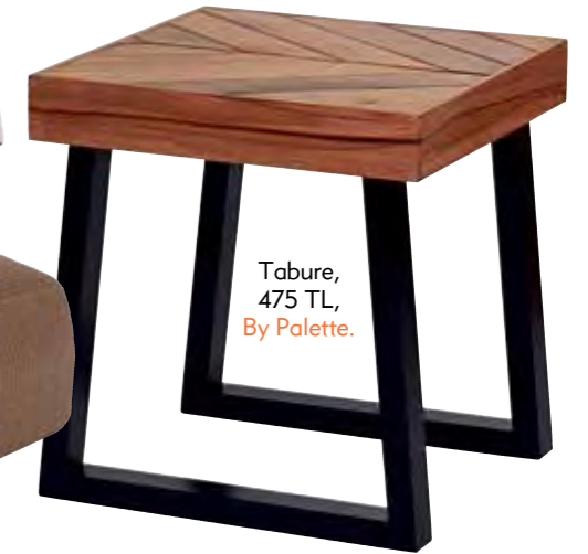
Tabure, 475 TL, By Palette.