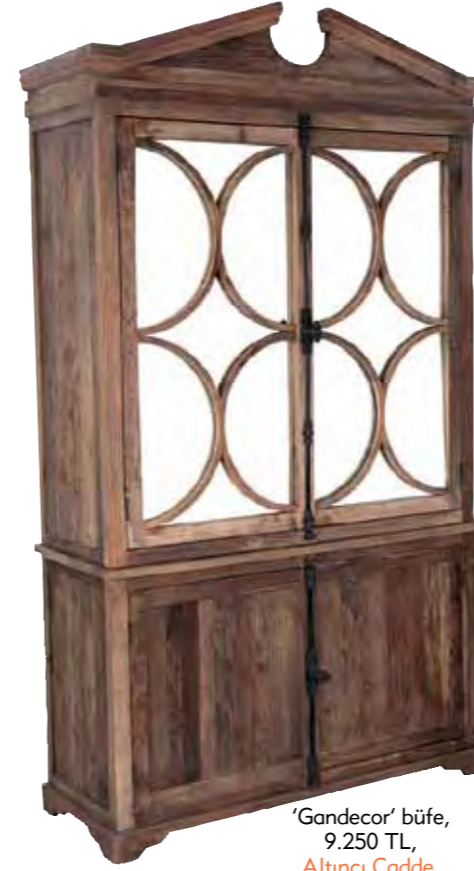
‘Gandecor’ büfe, 9.250 TL, Altıncı Cadden.